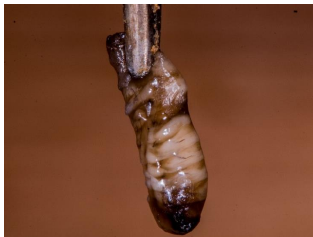
Pre-ninfa morta con accumulo di liquido

(rosso: celle completamente disopercolate pronte a essere svuotate – due frecce in alto a sinistra: rischio di confusione con la peste europea; blu: opercoli lacerati che iniziano a disopercolarsi)